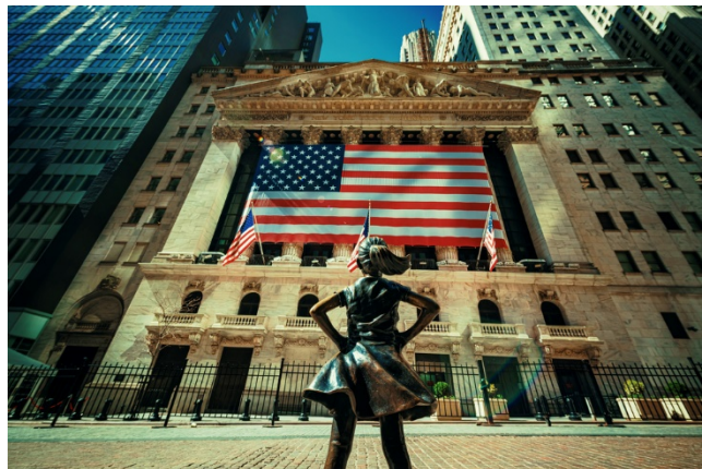
Wall Street désertée le 21 mars